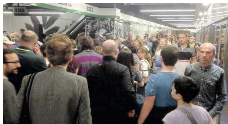
Passeggeri e curiosi nella fermata della metro C a San Giovanni