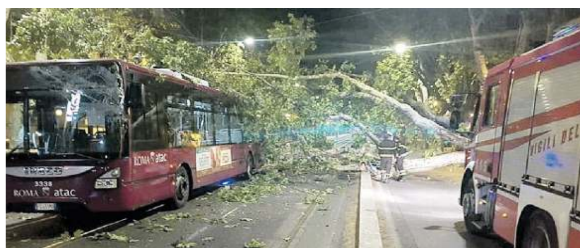
L'intervento dei vigili del fuoco per rimuovere l'albero caduto sul bus in viale delle Milizie

Viale delle Milizie. Dopo le fiamme e gli incidenti, è allarme